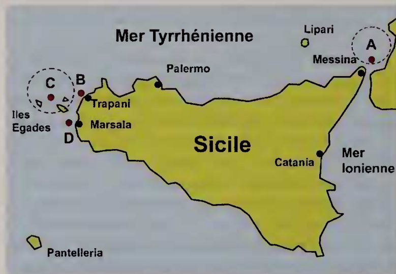
Figure 2 A-D. Aire de distribution de Pseudosimnia juanjosensii en Méditerranée centrale: A. Détroit de Messine, B. Trapani, C. Iles Egades, D. Marsala.

collection du Musée Malacologique de Cupra Maritima (Italie), étiqueté Trapani (Fig. 2B)].